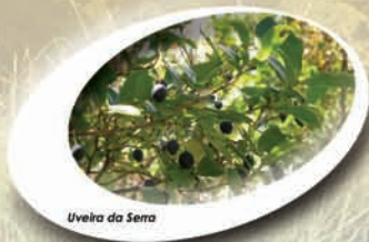
Uveira da Serra